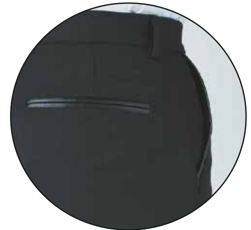
Poche dos finition effet cuir Back pocket with leather-effect finishing