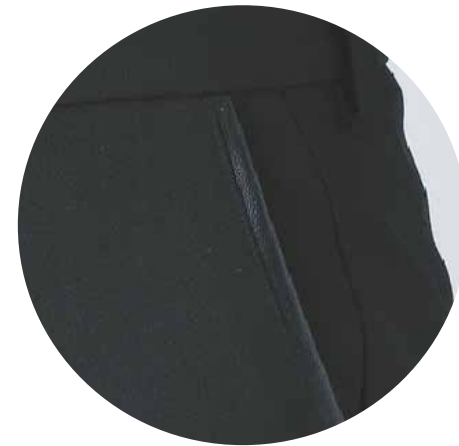
Poche italienne finition effet cuir Italian pocket with leather-effect finishing